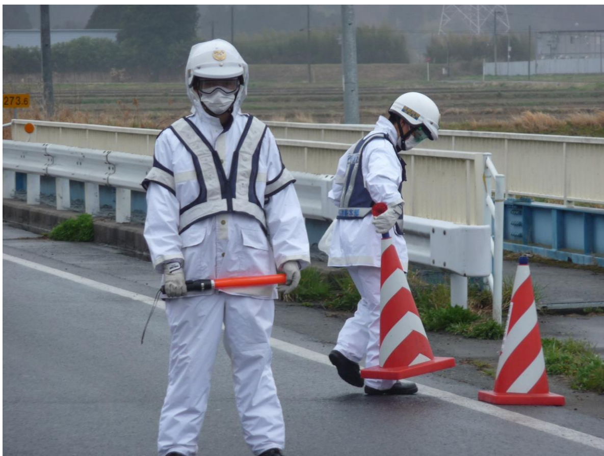
A 20 KM DEL LÍMITE EXTERNO DE FUKUSHIMA

Se planea incorporar más contenidos para esta nueva página temática, comenzando con la adición de resúmenes de la prensa japonesa y otra información de los primeros días del desastre. ¡Asegúrese de consultar regularmente el sitio a medida que agregamos más información!