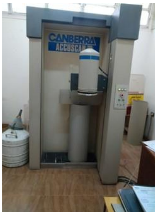
SISTEMA DE TLD PARA DOSIMETRÍA PERSONAL Y CONTADOR DE CUERPO ENTERO DEL DEPARTAMENTO