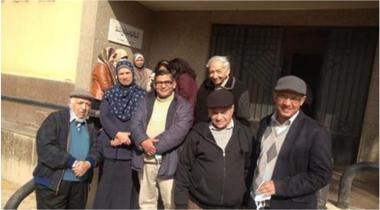
FOTO RECIENTE EN LA ENTRADA DEL DEPARTAMENTO. EN EL FONDO: MUJERES EN PROTECCIÓN RADIOLÓGICA.